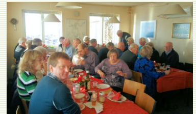
Alle er klar til julefrokosten

27-11-2010 blev den årlige julefrokost afholdt i klubhuset. Alt optaget, der kan kun være 28 personer i klubhuset.