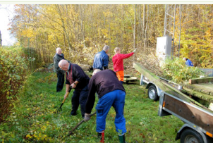
Oprydning DSB pladsen

Der bliver en del pæle som skal udskiftes til foråret og som kræver vi får ramslaget i vandet.